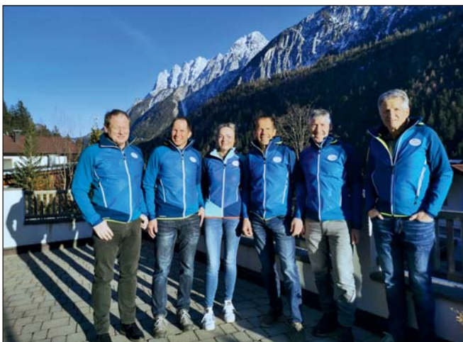
Vereinsvorstand des Alpinclubs Arnsteiger

Schon längere Zeit machten sich einige Vereinsmitglieder und der Vorstand Gedanken, über ein einheitliches Erscheinungsbild der Mitglieder bei verschiedenen Unternehmungen und Veranstaltungen. Das Jubiläumsjahr schien nun der richtige Zeitpunkt zu sein, um diesen Wunsch auch zu verwirklichen. Die Freude über die gelungene Auswahl dieser trendigen Mul-