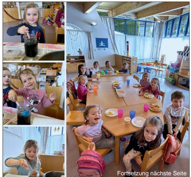
Fortsetzung nächste Seite

In der Zeit von Aschermittwoch bis Ostern hatten wir im Kindergarten mächtig viel zu tun. Wir dekorierten unseren Gruppenraum um, bastelten unsere Osternestln und Ostereier für den Osterstrauch, sangen verschiedene Frühlings- und Osterlieder und hörten viele Geschichten von Jesus.