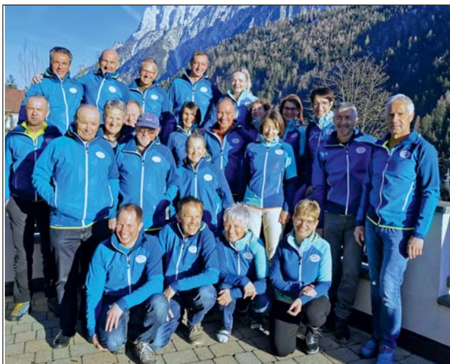
Vereinsmitglieder mit den neuen Jacken

05. 03. 2023: Vereinsjacke mit neuem Logo