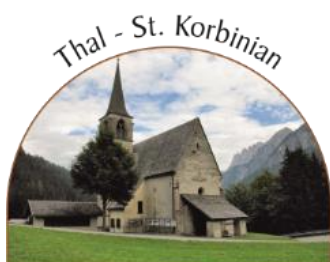
Christa Czopak ☎ 0681/20424350